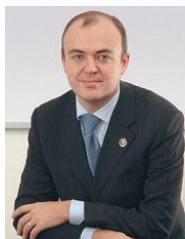
Новоселов Константин Викторович Заместитель начальника контрольного управления ФНС России, государственный советник Российской Федерации 2 класса, к.э.н.